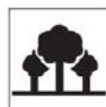
TAR - 3 Parque