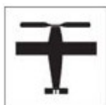
TAD - 1 Aeroclube