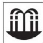
TNA-04 Estância Hidromineral