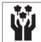
TNA-03 Patrimônio Natural