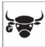
TIT-08 Exposição agropecuária