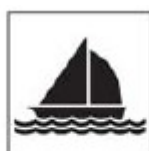
TAR - 2 Barco de passeio