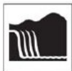
TNA-02 Cachoeira e Quedas d' água