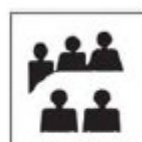
THC-04 Espaço cultural