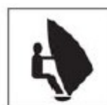
TAD - 3 Área para esportes náuticos