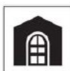
THC-02 Arquitetura Histórica