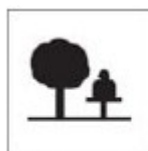
TAR - 1 Área de descanso