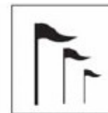
TIT-10 Pavilhão de feiras e exposições