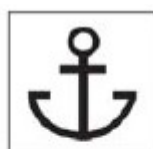
TAD - 2 Marina