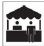
TIT-07 Feira Típica