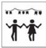
TIT-01 Festas Populares